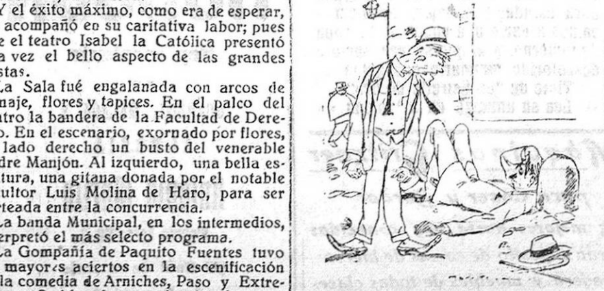
A LA MANERA INTERNACIONAL. —Y siempre que le encuentre a usted en mi camino haré lo mismo! —Es que no aceptaría usted para zanjar nuestras cuestiones un «pacto de garantías»?