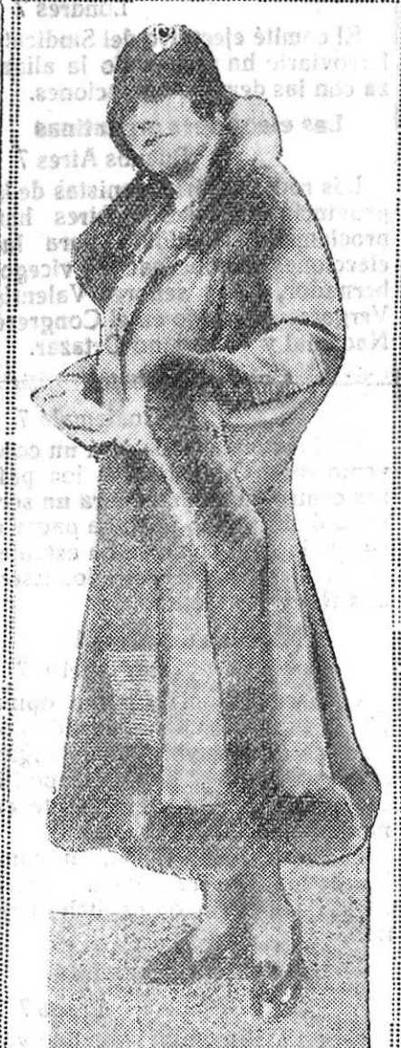
LA MODA.—Bonito y elegante abrigo de invierno, uno de los últimos modelos franceses

Se ha multado a un farmacéutico de un pueblo de los montes, por presentar denuncias infundadas e injuriosas contra un comerciante.