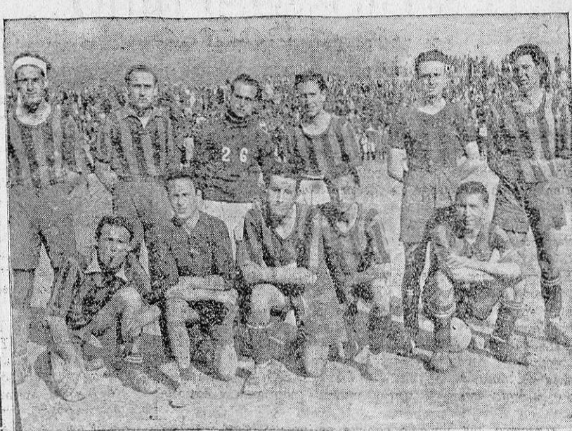
El «Club 26» de Guadix, el nuevo conjunto del fútbol acitano que empató el pasado domingo con la «Unión Calasancia» y que el día 12 se enfrentará con el «Alhambra».