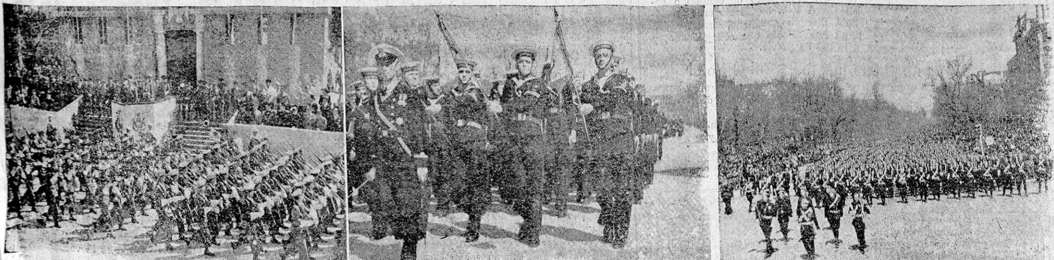
ANTE S. E. EL GENERALISIMO FRANCO SE CELEBRO EL GRAN DESFILE MILITAR CONMEMORATIVO DEL III ANIVERSARIO DE LA VICTORIA. LAS "FOTOS" RECOGEN EL PASO ANTE LA TRIBUNA DE LAS FUERZAS DE INFANTERIA, MARINA Y MILICIAS DE LA FALANGE.