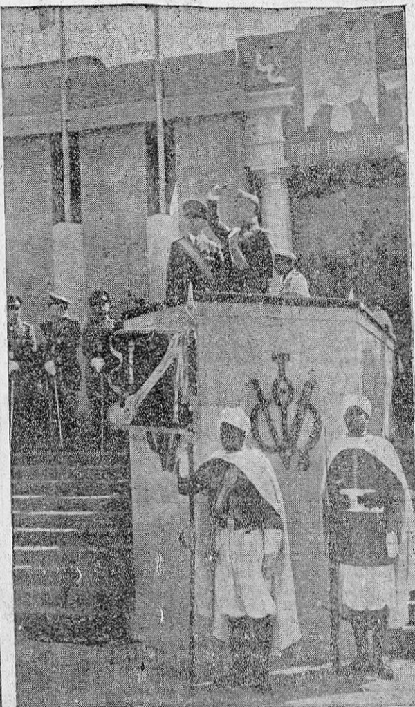
El Caudillo, con el ministro del Ejército, durante el gran desfile militar con el que se conmemoró el Día de la Victoria.

Berlín, 4.—Desde el 8 de septiembre de 1939, han sido hundidas por la Marina de guerra y la Aviación del Reich 16.274.000 toneladas de buques mercantes ingleses y norteamericanos. La Marina ha echado a pique 12 millones de toneladas, cifra en la cual participa el arma submarina con 9.082.000 toneladas. La Aviación, por su parte, ha hundido 4.106.000. Los aviones del Reich habían sobrepasado la cifra de cuatro millones de toneladas a fines del mes de enero. Las unidades navales de superficie han contribuido también notablemente al aumento de la cifra de buques mercantes hundidos.—Efe.