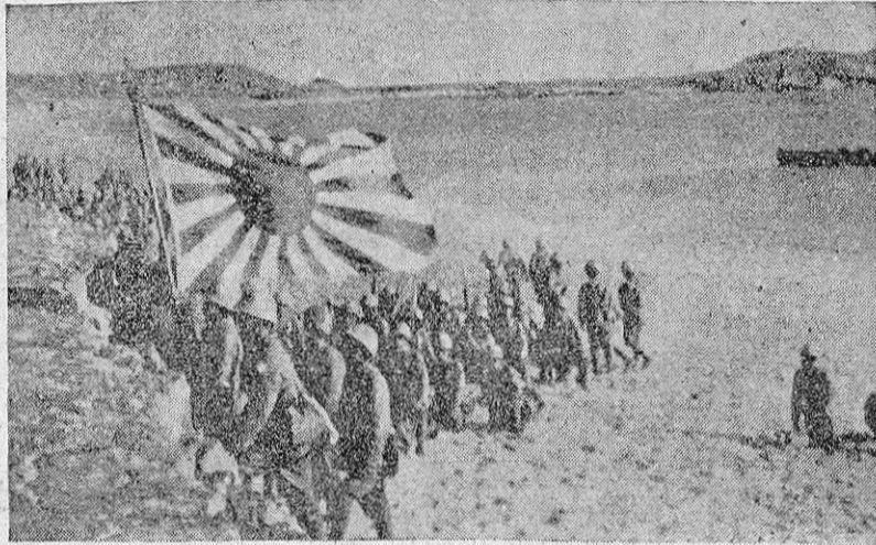
Una columna japonesa acaba de desembarcar en una isla del Pacífico. Y, desplegada la bandera, se disponen los soldados a comenzar el combate.

Como resultado de todas estas consideraciones, los observadores norteamericanos concluyen que Inglaterra, Estados Unidos y sus aliados tendrán que batirse en la India en la desesperada.