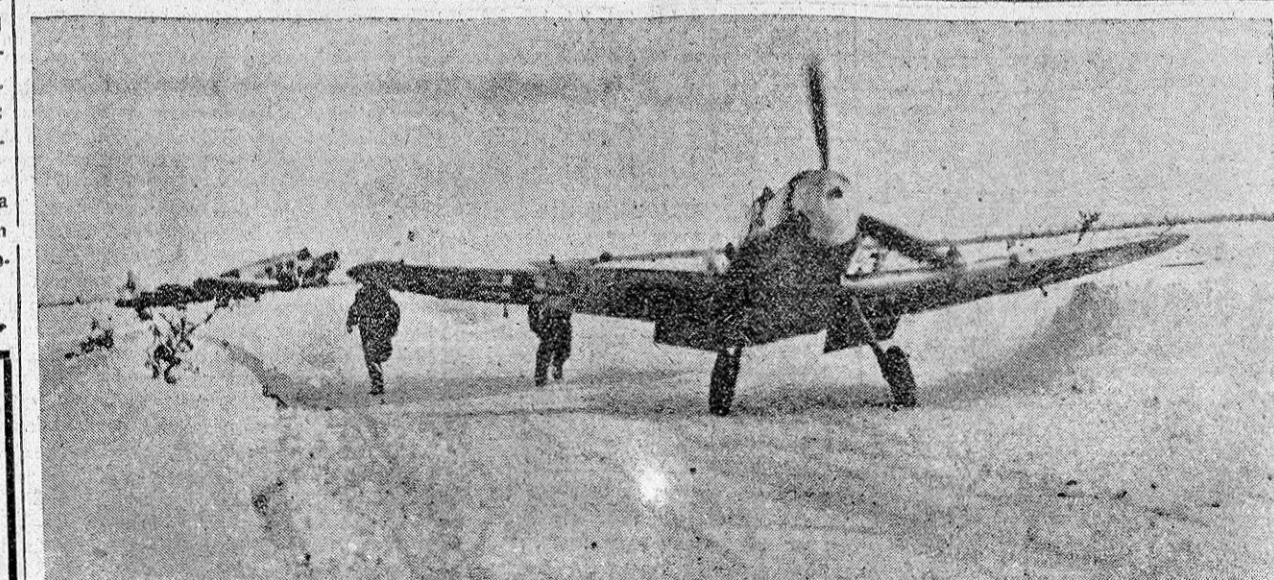
A pesar de la llegada de la primavera, la nieve no ha abandonado aún el norte de Europa. He aquí un aeródromo improvisado en la Carelia, en el que un avión alemán se dispone a despegar sobre la blanca llanura.