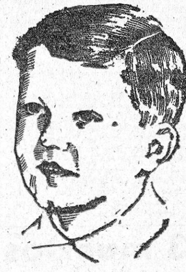
SIMEON II, ACTUAL REY DE BULGARIA

Consolidada la situación interna, Boris III empleó todas sus fuerzas para abrir el cerco que la derrota militar había forjado a su alrededor.