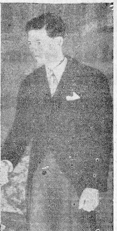
EL REY MIGUEL, DE RUMANIA