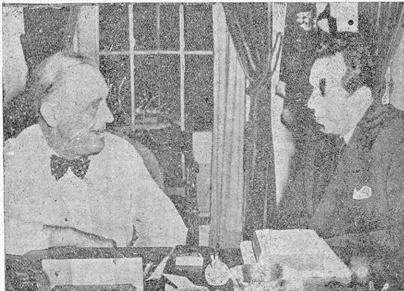
El doctor Ezequiel Padilla, ministro de Asuntos Exteriores de México, conferenciando con el presidente Roosevelt durante su visita a Washington.