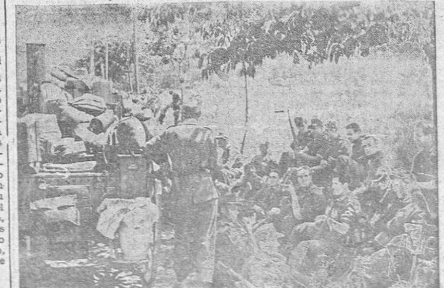
Una división de infantería alemana que se dirige al sector central del frente del Este hace un alto en el camino para descansar.