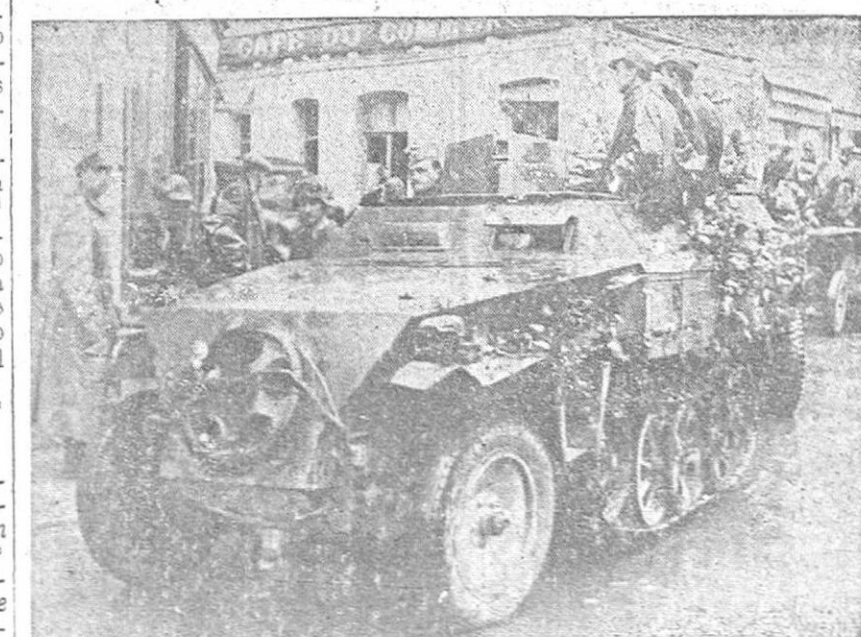
Carros de asfalto alemanes atravesando una localidad holandesa en dirección al frente.