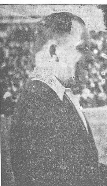
(Información en 2.ª página)

VILALTA arbitrará el partido Granada-Murcia