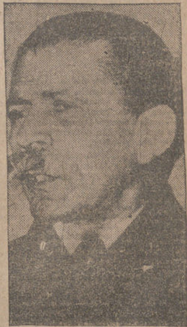
Hussein Ala, embajador del Irán en Washington, que ha hecho unas sensacionales declaraciones poniendo de relieve los intentos tortuosos de la política soviética para apoderarse de las concesiones petrolíferas de su país.