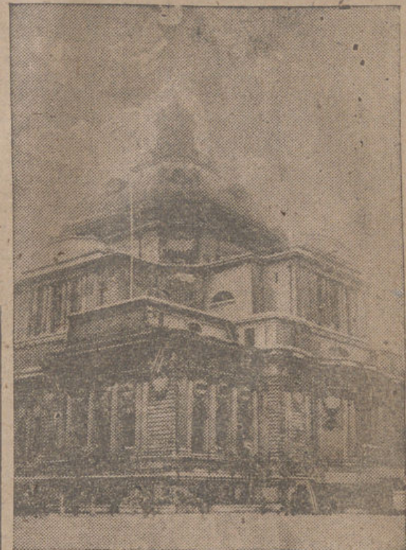
En este edificio —el Central Hall, de Westminster, en Londres— va a reunirse por vez primera mañana, jueves la Asamblea general de la O. N. U. (Organización de las Naciones Unidas).