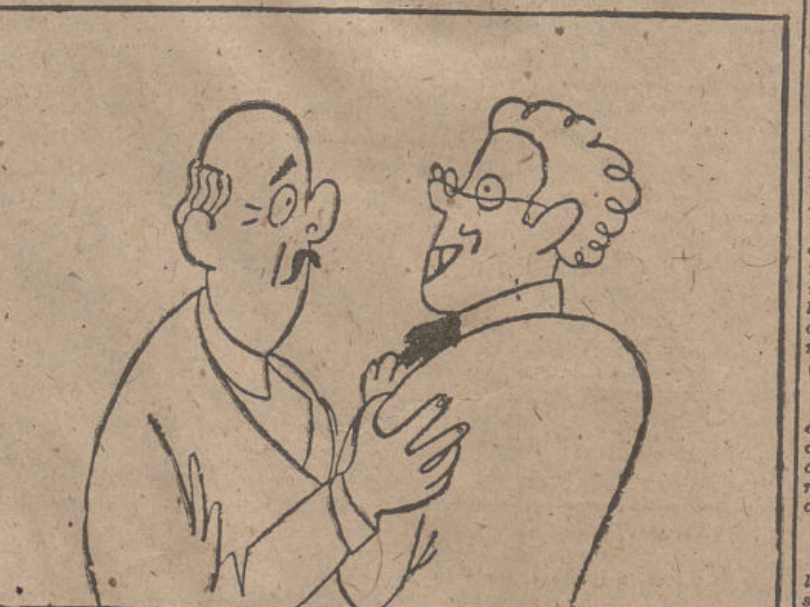
EL DOCTOR.—¿Por qué me ha devuelto usted la factura sin cobrarla del sobre? EL CLIENTE.—Porque usted mismo me recomendó que evitara las emociones fuertes.