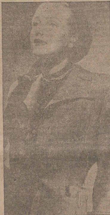
Esta bella muchacha norteamericana muestra una nueva "radio de bolsillo", un superheterodino de cinco lámparas, que cuesta unas 305 pesetas y que lleva en el bolsillo izquierdo de su chaqueta.