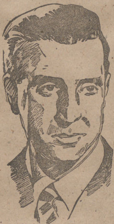
SR. MARTIN ARTAJO

En el curso de la conversación, y después de dirigir un cordial saludo de bienvenida a los periodistas, el señor Martín Artajo dijo ser la ocasión buena para mirar a los últimos meses del año que ha terminado. Miradas las cosas de España, en el orden internacional, con altura y serenidad, hay motivos fundados —dijo— para un sosegado optimismo. Hemos pasado los seis primeros meses de la posguerra, que tenían que ser, para los periodistas que hacen información en los diarios madrileños y agencias de noticias, visitaron al ministro de Asuntos Exteriores, señor Martín Artajo, para felicitarle el año nuevo, siendo obsequiados por éste con un aperitivo.