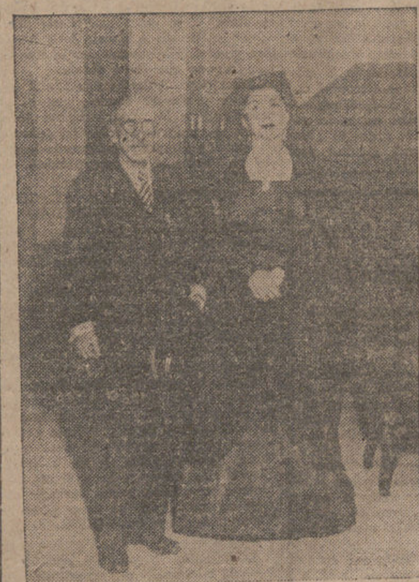
El estreno de "La Infanzona" en Buenos Aires ha constituido el último y ruidoso triunfo del gran dramaturgo español don Jacinto Benavente, a quien vemos en la fotografía acompañado de la intérprete, Lola Membrives.

por ser tratados los grandes problemas del control de la bomba atómica y la redacción de los Tratados de paz europeos. Si se franquean estas dos barreras, o incluso, si se evita una abierta escisión, entonces podrá considerarse que la reunión ha tenido un éxito completo.