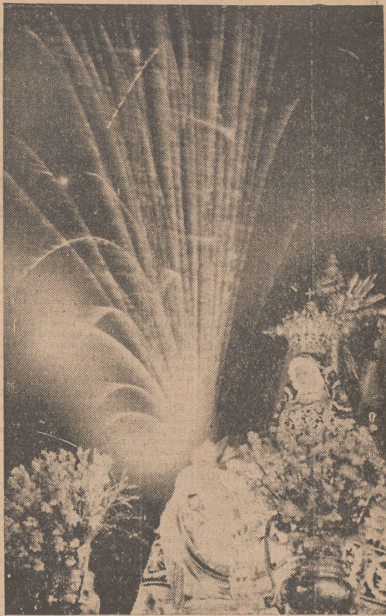
Fantástico aspecto de la imagen de nuestra Patrona, la Santísima Virgen de las Angustias, a su paso por Puerta Real, entre el resplandor de las palmas reales disparadas en aquel céntrico lugar.