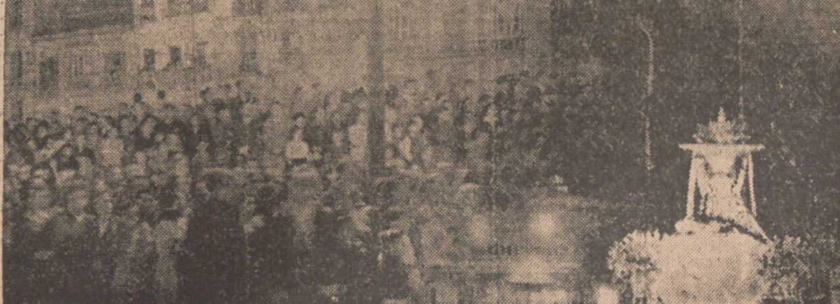
Decenas de millares de personas, Granada en masa, sin excepción de clases, presenciaron el domingo la triunfal procesion de nuestra excelsa Patrona, la Virgen de las Angustias. Dos aspectos del magno desfile religioso al paso de la Virgen por el Embovedado y frente a la fuente de las Batallas.