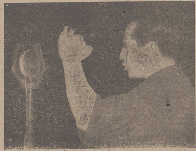
José Antonio, durante el histórico discurso fundacional de la Falange, pronunciado en el teatro de la Comedia, de Madrid, hoy hace exactamente catorce años.

Nunca en España se había escuchado una voz como aquella. La vieja política sabía mucho de problemas eventuales, pero todo o casi todo lo ignoraba en materia de anhelos eternos. Por primera vez se hablaba desde el