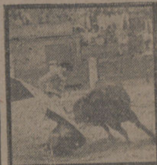
Ortega, adornándose en su primero.