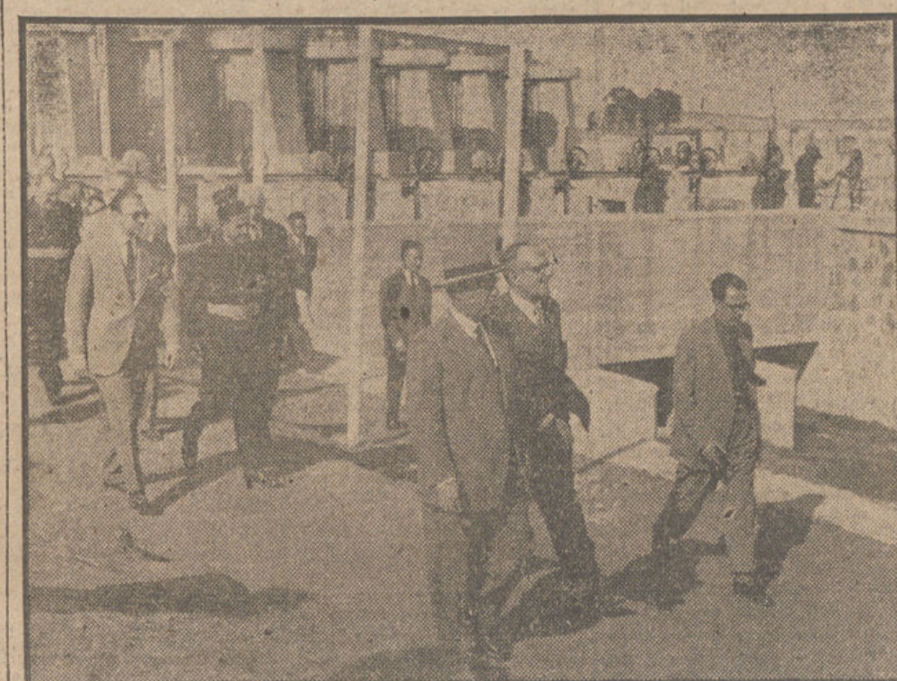
S. E. el Jefe del Estado, acompañado de las personalidades de su séquito, durante la visita que hizo a la presa de Montijo, en el pantano de Cijara, que regará ocho mil hectáreas de terreno.

Otro telegrama misterioso recibido por Scotland Yard