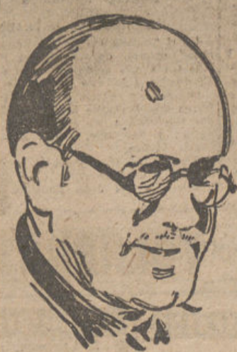
SR. IBÁÑEZ MARTIN

DATCHEF (Berkshire, Inglaterra), 9. (EFE). — La princesa Margarita recibió una verdadera ducha al romperse un toldo bajo el que se hallaba y en el que estaba depositada agua de un reciente chaparrón, en ocasión de inaugurar un campo de deportes en esta localidad. La princesa facilitó la continuación del acto tomando la cosa a broma, hasta el punto de reír a carcajadas.