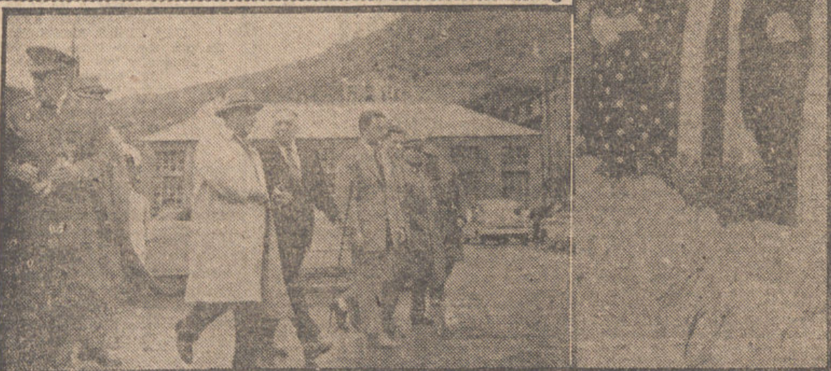
En estas dos fotografías, S. E. el Jefe del Estado, acompañado de su séquito, durante su visita a las instalaciones hidroeléctricas de la cuenca del Ribagorza...