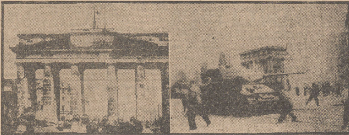
A la izquierda: los manifestantes izan en lo alto de la Puerta de Brandemburgo la bandera de Alemania occidental, donde antes ondeaba la bandera roja del Gobierno comunista. A la derecha: tanques rusos prestan servicio en las calles, para contener las demostraciones anticomunistas de estos días, en el sector soviético de Berlín.—(Fot. CIFRA, transmitida por radio).