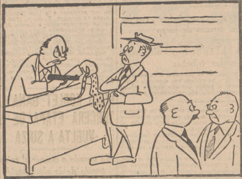
—Es nuestro mejor vendedor. No se le va ningún cliente sin comprar algo.