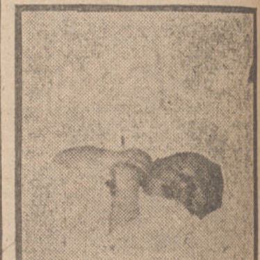
FUAD DE EGIPTO

El anuncio, hecho por un portavoz del cuartel general del Ejército fue hecho después de la reunión del Gobierno, a la que asistieron también los miembros de la Junta militar del general Naguib.