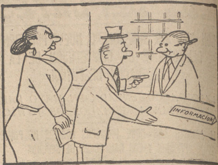
—¿Puede usted probarme que esa señora es su mujer? —Mil pesetas le doy si puede probarme que no lo es.