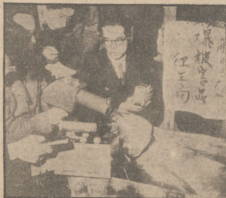
Oficiales del servicio sanitario metropolitano emplean un detector para encontrar pruebas de radioactividad en un gran atún, de los varios pescados por la tripulación del barco japonés "Fukuru Maru". Veintitrés pescadores regresaron a Shizuoka, desde las aguas próximas al atolón de Eniwetok, con sus manos, caras y pelos quemados por el polvo radioactivo.