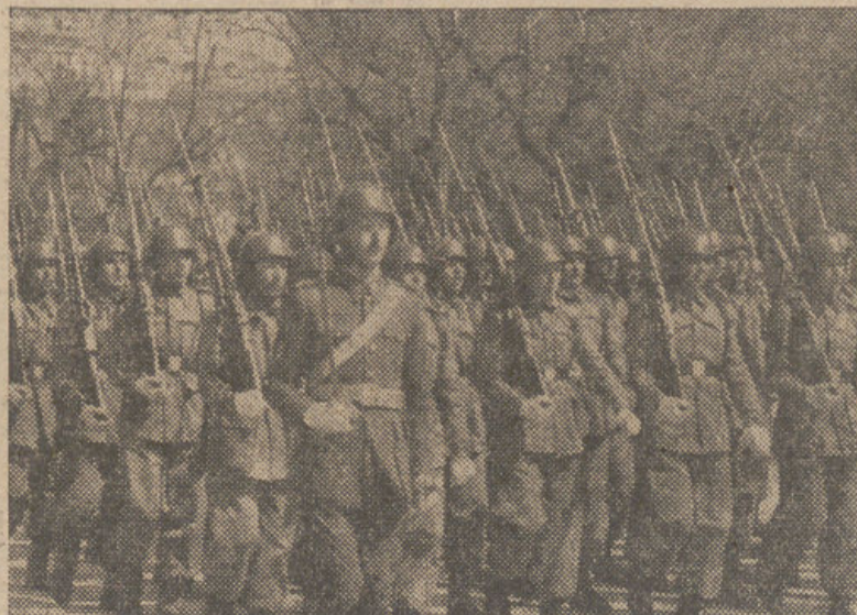
La gloriosa y fiel Infantería, versión moderna de los Tercios que engendraron el Imperio, forjadora de la Victoria de 1939, y siempre crisol de nuestras mejores virtudes militares, levadura de la Raza, columna de la Patria. Sobre sus bayonetas, en cuyos aceros se quiebra el sol de tantas gestas heroicas, descansa la defensa del Honor, la seguridad de nuestra rabiosa independencia y la firme garantía de nuestra santa y digna Paz española...