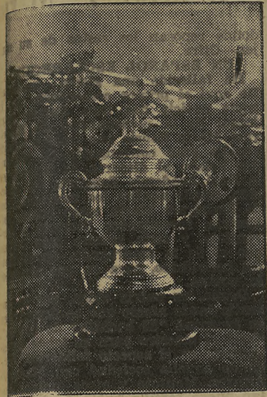
La Copa "Jerez Industrial" que esta tarde se disputa en el campo de Chapín.

Aumenta la animación en las tiradas oficiales de Chapín Hoy terminará el Campeonato de Jerez y se disputará la Copa "Jerez Industrial"