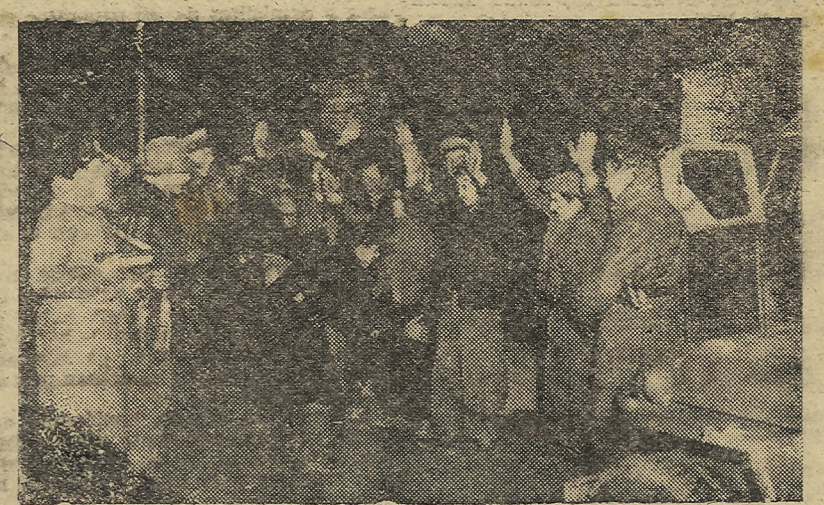
Milán.—La policía italiana efectuando detenciones de elementos indeseables en los suburbios de Milán, con motivo de los últimos desórdenes provocados por los comunistas.