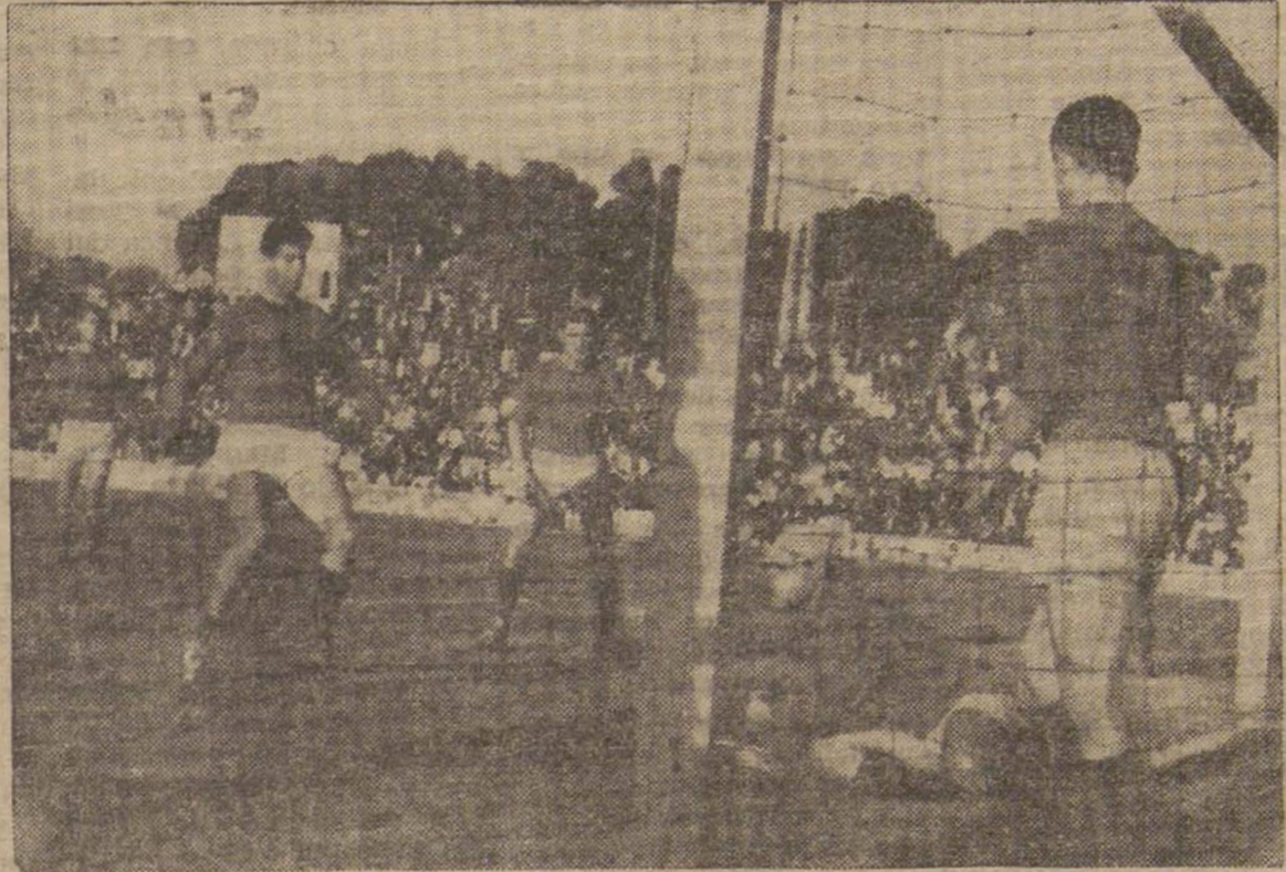
El portero forastero trabajó lo que pudo, pero no siempre con acierto. Era mucho lo que se le venía encima. En esta ocasión se hizo con la pelota.

sean muchos— se habrán quedado como unas pasucas con esos seis golitos que le metieron a un casi colista. Pues bien, para que no se engañen ni unos ni otros vamos a decirles que si no mejoran, más les vale evitarse el disgusto de la ligüilla, dando por hipótesis que sean ellos los que la jueguen. Con el juego de unos y otros no se va a ninguna parte. Si éste es el fútbol de los mandones en la Tercera División, más nos valdría no pensar en ello y pedir a la Providencia que por lo menos nos mantenga días tan soleados como el del domingo para que a falta de fútbol, en los partidos nos sea permitido tomar lindamente el sol.