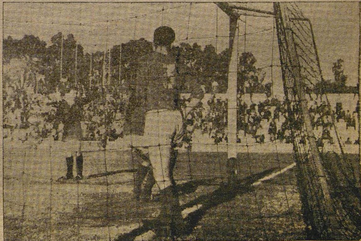
Uno de los seis. Ahí está, entre las redes, como un pez capturado, el balón que significaba un gol más en la cuenta jerezanista.