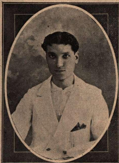
JOSÉ DE PRADA

Brillante escritor, periodista y orador notabilísimo, autor de las obras de gran éxito Cádiz , tacita de plata y La Detective , que se representan cada noche entre entusiastas ovaciones en nuestro Teatro de Verano, y cuyos recientes triunfos en la prensa y en la escena le han colocado en primera línea entre los escritores contemporáneos.