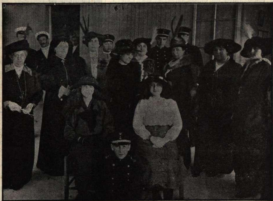
Grupo de invitados á la simpática fiesta celebrada el pasado domingo 12.