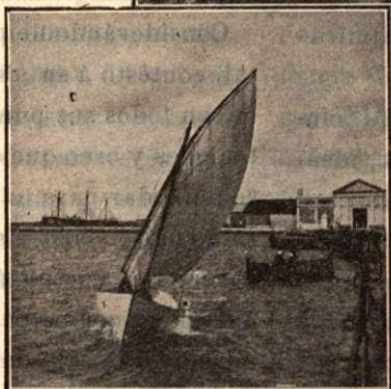
Entrada al Arsenal de la Carraca.