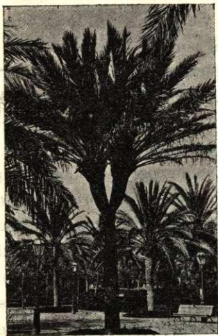
Parque Genovés: Palmera de dos brazos.

arrollo del temperamento del niño, es una de las obligaciones más sagradas de nuestro sistema educativo: por eso los gobiernos, los poderes públicos y sociales, las clases acomodadas y todas las que tienen grandes medios á sus alcances, deben prestar gran apoyo moral y material á todas aquellas instituciones cuya misión y base fundamental tienda á la educación físico-moral del niño.