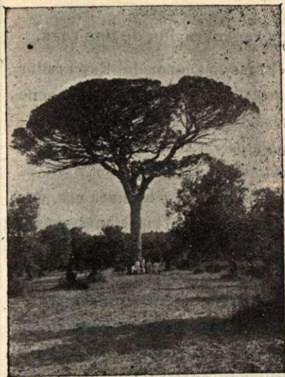
Notable ejemplar de pino en la carretera de Olvera (Cádiz).