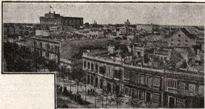
San Fernando (Cádiz).—Al fondo se ve el magnífico edificio del Ayuntamiento.