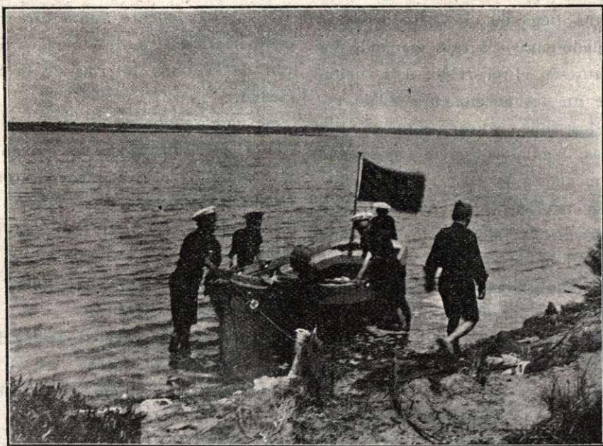
Los exploradores desembarcando en el río San Pedro.

A las diez de la mañana, desatracó el bote «Explorador» del muelle Victoria, y puesta proa á la costa del Puerto de Santa María, dejando á estribor el trasatlántico «Alfonso XII» fondeado en la canal; en media hora de boga sostenida doblaron la barra