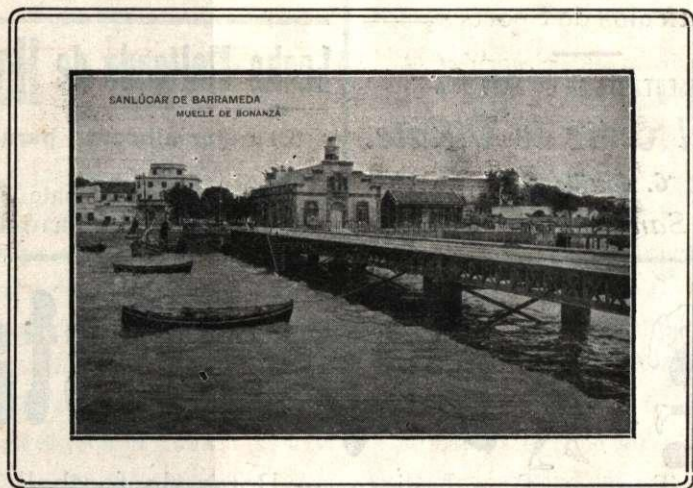
Sanlúcar de Barrameda (Cádiz): Muelle de Bonanza, sitio muy frecuentado por los turistas.