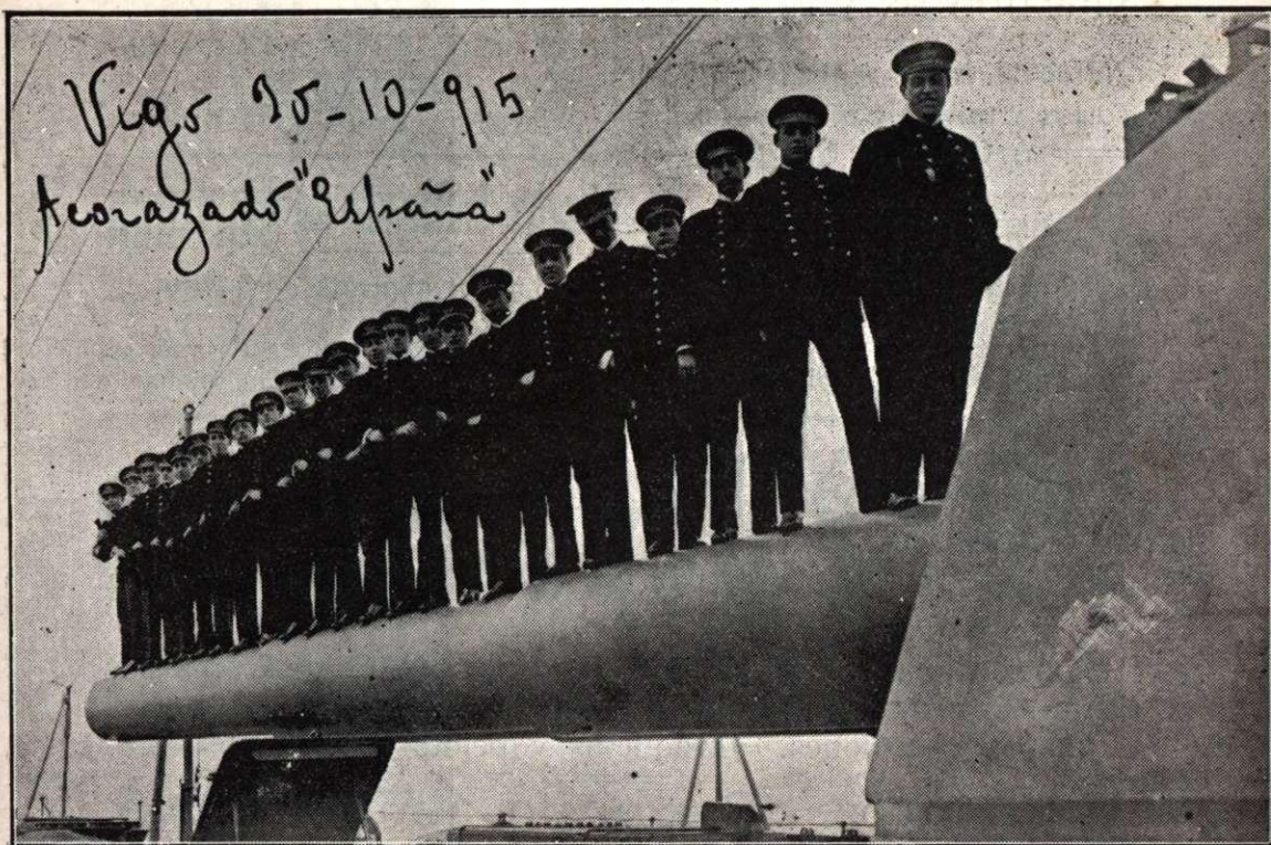
Guardias Marinas subidos en un cañón de 305 milímetros de la torre de proa del acorazado España , en donde han realizado el viaje de prácticas.

Redacción y Administración. Fernán Caballero, 16, 1.º