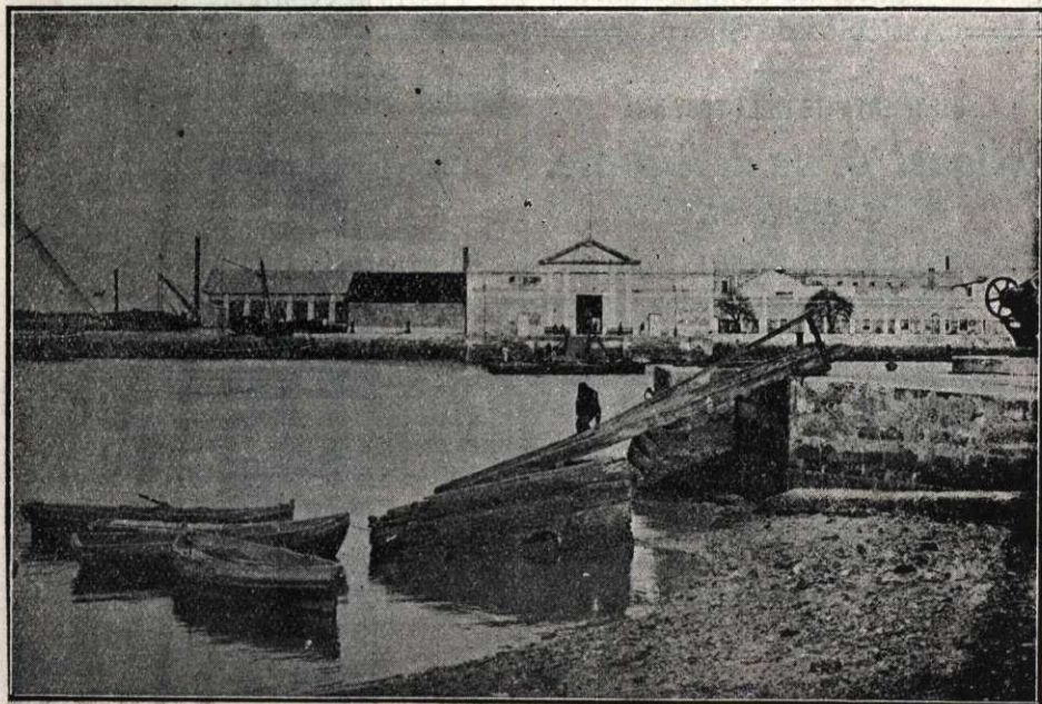
El Arsenal de la Carraca. (San Fernando.—Cádiz).