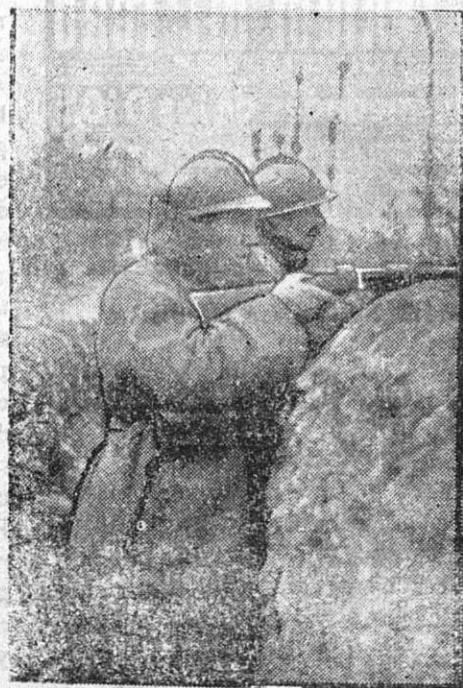
Soldados franceses e italianos en una trinchera del Piave.