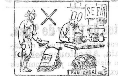
La solución en el próximo número