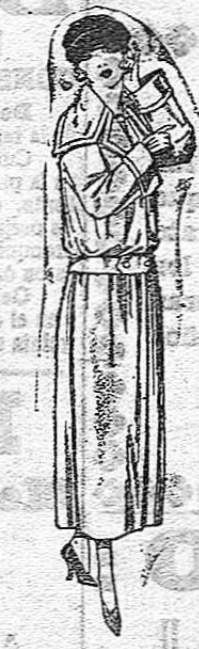
Guardapolvos de dril crudo, gris, etc. De ptas. 25 a 40