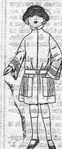
Abrigos de gamuza, cheviot, etc. en azul y color para niñas de 4 a 9 años. De ptas. 33 a 40