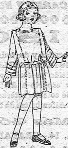
Vestido de sarga, popeline, etc. adorno y respunte seda, para niñas de 4 a 9 años. De ptas. 35 a 42