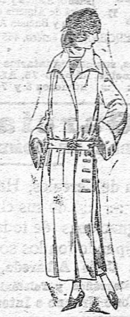
Abrigos de gamuza, gaborin, etc. en negro, azul y color. De ptas. 70 a 100