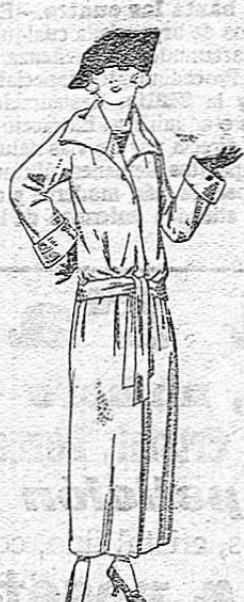
Guardapolvos de dril, satén etc. colores moda. De ptas. 29 a 50