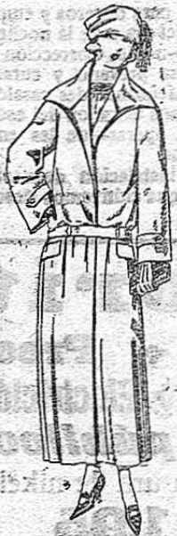
Abrigos de gabardina impermeabilizada en negro, azul y color. De ptas. 70 a 165