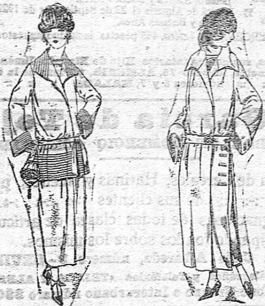
Trajes sastre de sarga inglesa, cheviot, etc. De ptas. 130 a 165

SUCURSALES.--Madrid, Barcelona, Alicante, Almería, Bilbao, Cartagena, Cádiz, Gijón, Málaga, Palma de Mallorca, Santander Sevilla, Valencia, Valladolid, Zaragoza.