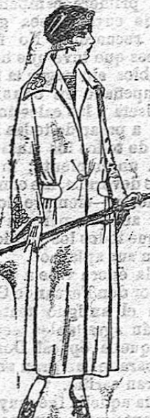
Abrigos de gamuza, ratón, etc., adornos bordados. De ptas. 85 a 110