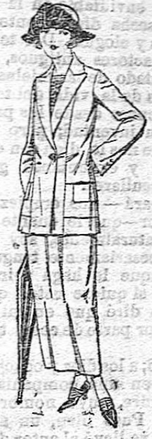
Trajes sastre de sarga, estambre, etc. en negro, azul y color, forros seda. De ptas. 115 a 150