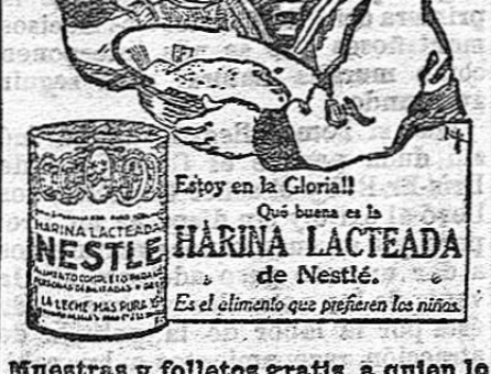
¡Enjoy en la Gloria! ¡Que buena es la HARINA LACTEADA de Nestlé! Es el alimento que preparan las niñas.

Sociedad Anónima S. Pedro Eléctrica del Maitena GRANADA Emisión de 760.000 pesetas nominales en 1.500 obligaciones, 7 por 100 al portador de 500 pesetas cada una.