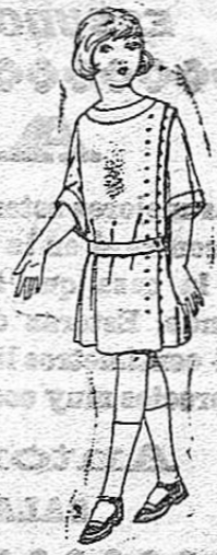
Vestidos de crepé de lana, estambre, etc. en azul y color, para niñas de 4 a 9 años. De ptas. 30 a 40