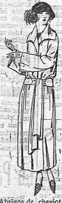
Abrigos de cheviot, ratón, etc. en negro, azul y color. De ptas. 50 a 75