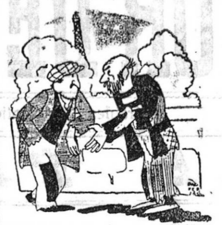
—Todos los días, bañistas que perecen; automovilistas que se matan... —Por algo yo no he subido nunca en auto ni me he bañado nunca...