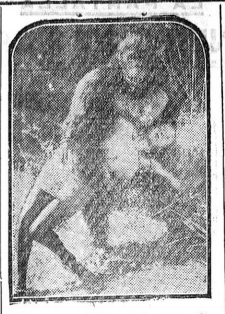
Una escena de la emocionante película «Ingagi», film impresionado en el corazón de África salvaje.

«EL DEFENSOR DE GRANADA» ES EL DIARIO QUE MAS CIRCULA EN GRANADA Y SU PROVINCIA