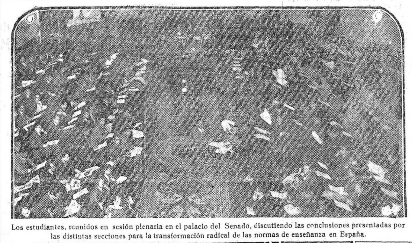
Los estudiantes, reunidos en sesión plenaria en el palacio del Senado, discutiendo las conclusiones presentadas por las distintas secciones para la transformación radical de las normas de enseñanza en España.