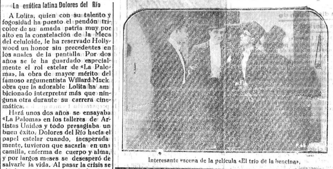
Interesante escena de la película «El trio de la bencina».

La exótica latina Dolores del Río a Lolita, quien con su talento y fogosidad ha puesto el pendón tricolor de su amada patria muy por alto en la constelación de la Meca del celuloide, le ha reservado Hollywood un honor sin precedentes en los anales de la pantalla.