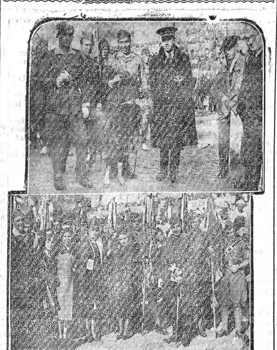
Arriba, varios oficiales del Tercio con la mascota de la Legión. Abajo, un grupo de modistas madrileñas obsequiando con flores a los legionarios en el momento de partir para África.