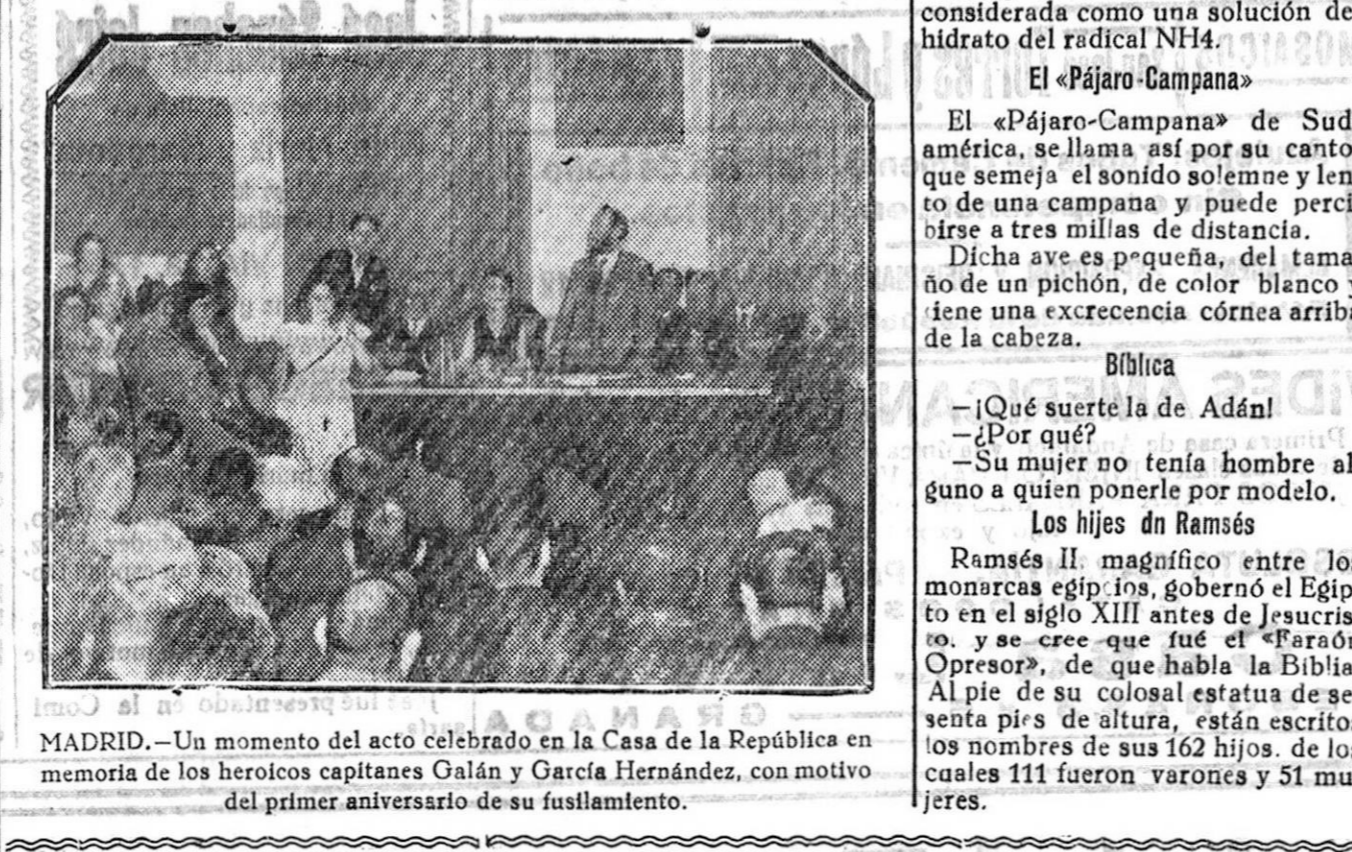
MADRID.—Un momento del acto celebrado en la Casa de la República en memoria de los heroicos capitanes Galán y García Hernández, con motivo del primer aniversario de su fusilamiento.

El tren bólide Hace poco se ha inaugurado en Milagrove, cerca de Clavijo, el llamado «tren torpeda», o «tren bólide», primero de los ferrocarriles aéreos de Escocia, construido con arreglo al mismo principio de los que vienen funcionando en los Estados Unidos y Alemania, y se basan en el carril único y el vagón suspendido e impulsado por la fuerza eléctrica, pudiendo citarse como uno de los modelos más recientes el que hace servicio entre Elbertel y Barmen, en Alemania.