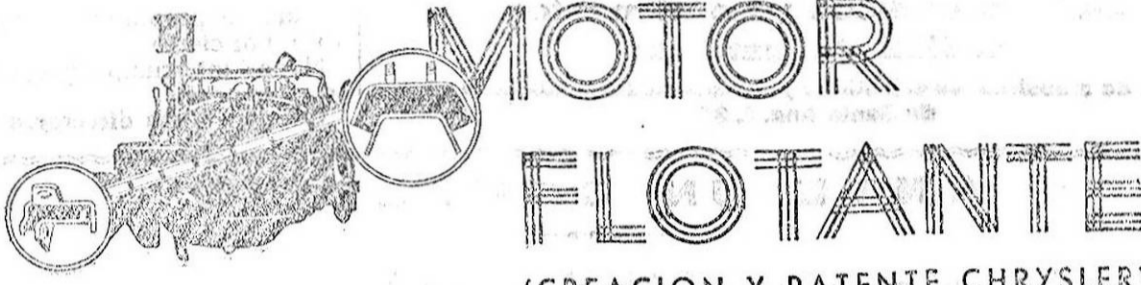
MOTOR FLOTANTE (CREACION Y PATENTE CHRYSLER)

UN "CUATRO CILINDROS" SUAVE COMO UN "OCHO"