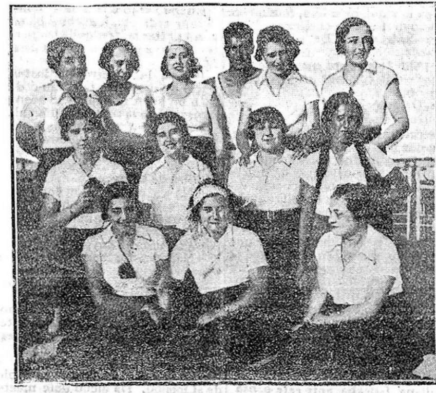
BARCELONA.—Regatas internacionales femeninas. Las señoritas del equipo Español Club Marítimo, vencedoras.