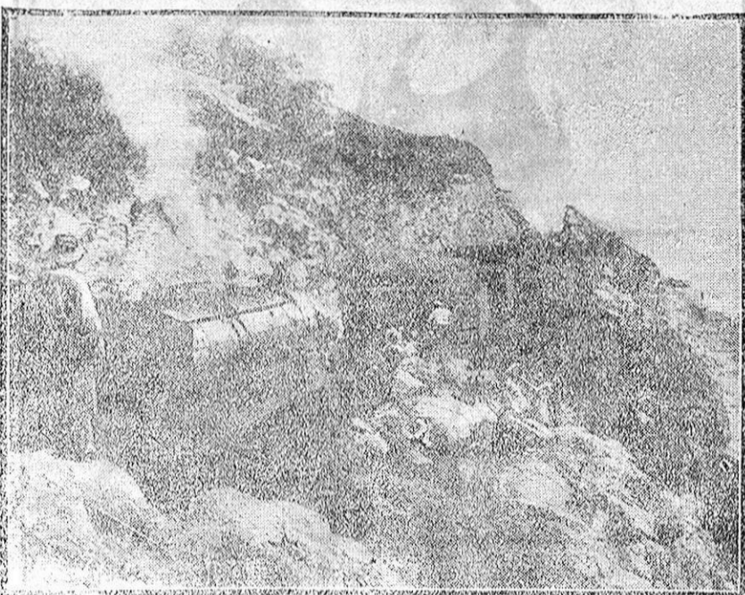
DESCARRILAMIENTO DE UN TREN DE MERCANCIAS.—En las costas de Garrá, cerca de Castelldefels, descarriló un tren de mercancías procedente de Tarragona. Volcaron algunos vagones y fueron arrastrados un buen trecho por el resto del convoy, cayendo algunos de ellos a la playa.

Respecto a la lista de deportados, dijo que hasta la fecha, como se había visto, no había ninguno de Granada.