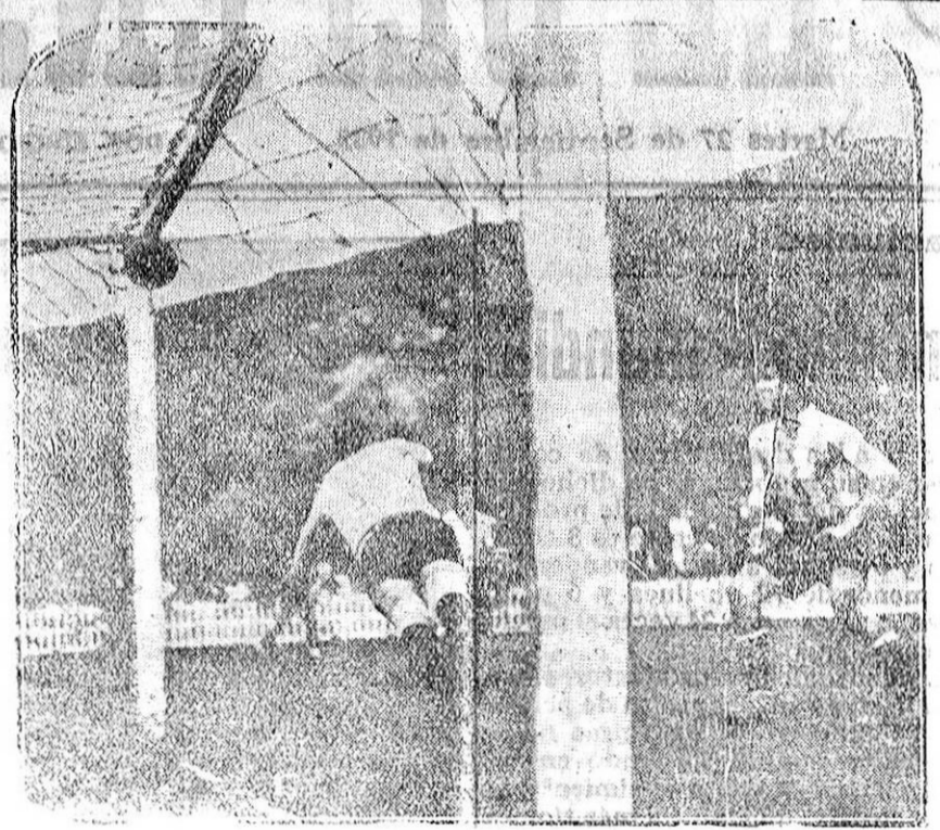
LOS CAMPEONATOS REGIONALES VUELVEN.—En el de Vizcaya, el Arenas hace entrada de caballo Siciliano, obteniendo tantos como éste.