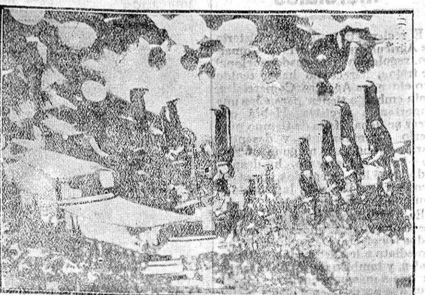
El nuevo presidente de Méjico, general Abelardo L. Rodríguez, saliendo de su automóvil para entrar en el Congreso a jurar el cargo.

El encuentro estaba concertado a quince rounds y era eliminatorio para el campeonato mundial.