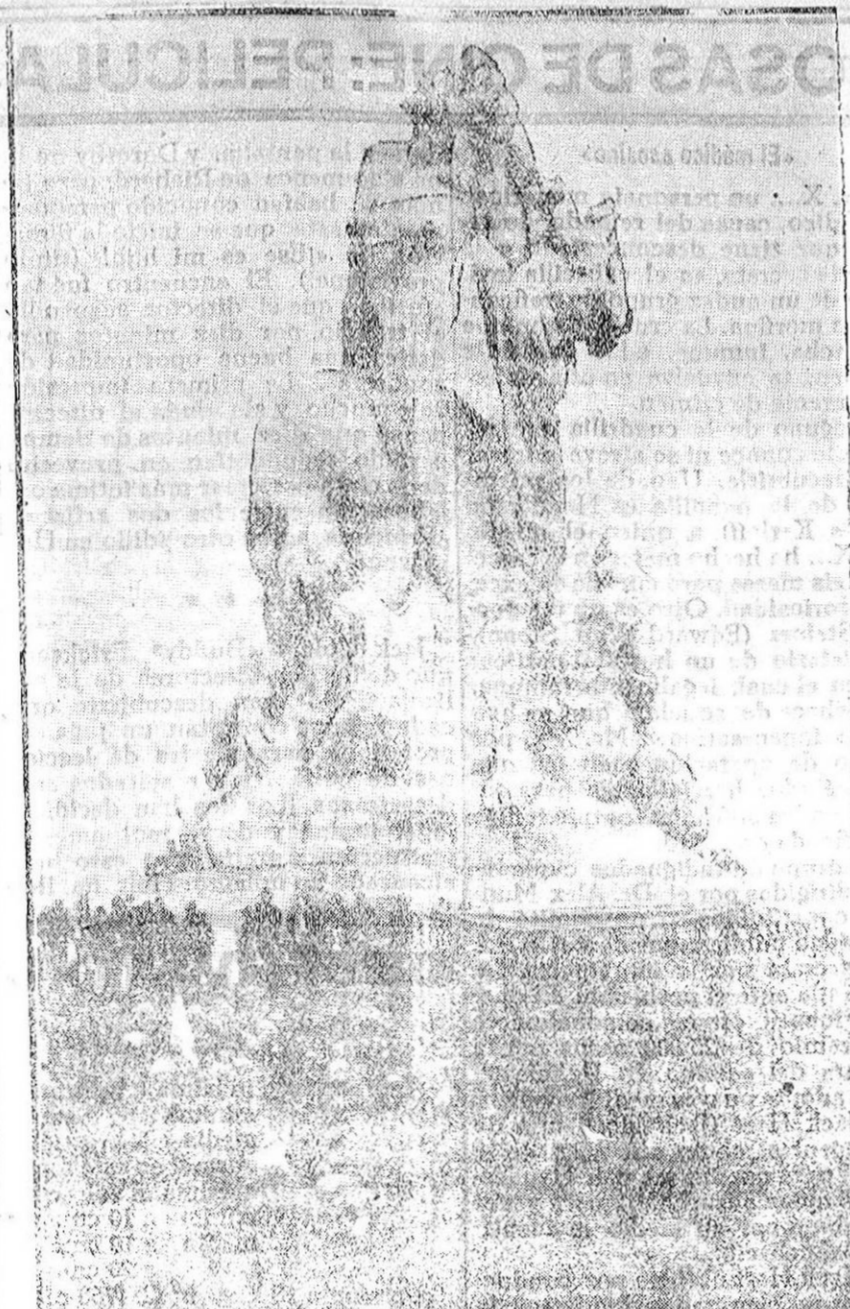
El jefe del Gobierno francés, señor Herriot, leyendo su discurso en la inauguración del monumento ofrecido por Norteamérica a Francia para conmemorar la victoria aliada de la batalla del Marne. El monumento se ha erigido en Varedes, cerca de Meaux.

Los trabajos preparatorios de la comisión organizadora de los festejos que han de celebrarse los días 1 y 2 del próximo mes de Octubre se llevan muy adelantados, dándose por un hecho la celebración de dos verbenas en ambos días, en el patio del ex cuartel de Santo Domingo, que estarán amenizadas por una orquesta de jazz band. Habrá en las mismas columpios, puestos de churrros, y se instalará una artística iluminación de originales bombos, rematándose las guirnaldas con banderines tricolores, escudos, etc.