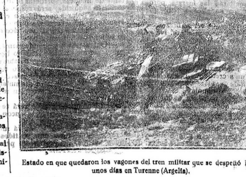
Estado en que quedaron los vagones del tren militar que se despejó hace unos días en Turanne (Argelia).