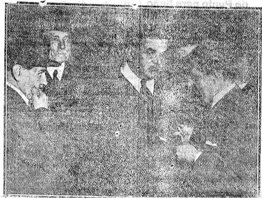
El señor Herriot al partir con dirección a Ginebra, haciendo declaraciones para la Prensa sobre la cuestión de la igualdad de armamentos que ha de discutir la Conferencia del Desarme.

«El estado de guerra» y la «suspensión de garantías» no pueden continuar siendo con la República a mane-