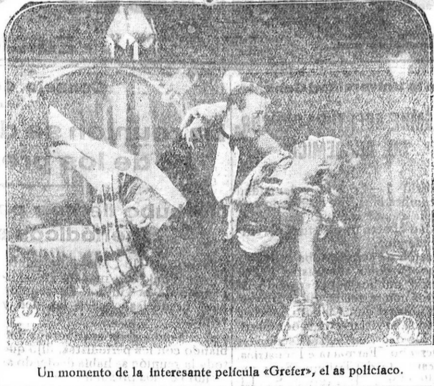
Un momento de la interesante película «Grefers», el as policia.

Nada tan divertido como la trágica comedia de la Metro Goldwyn cuyo