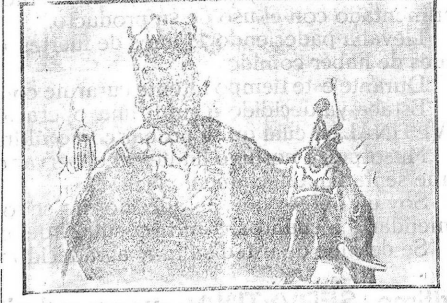
PASATIEMPOS DE VILLA CISNEROS. UN EXCURSIONISTA.—¡Eh, tú, Hamido! ¿Quieres hacer el cuarto al bridge?