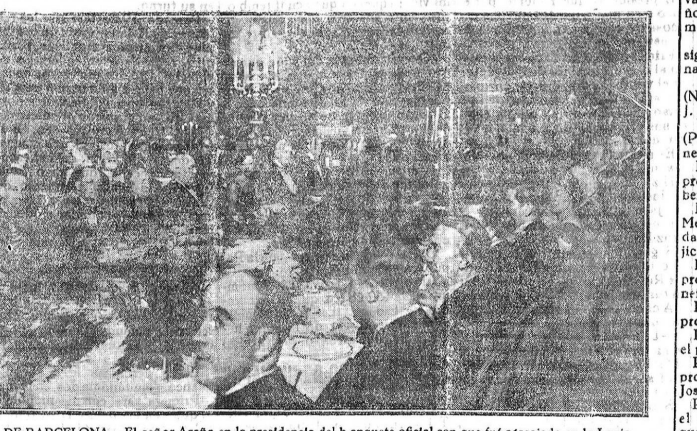
DE BARCELONA.—El señor Azaña en la presidencia del banquete oficial con que fué agasajado en la Loriga.

—Cuando se acerca a mí, siento frío en mi corazón, me invade una