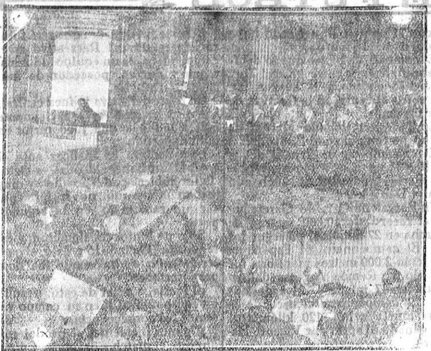
MADRID.—Sesión inaugural del Congreso de Otorinolaringología, presidida por el señor Alcalá Zamora.