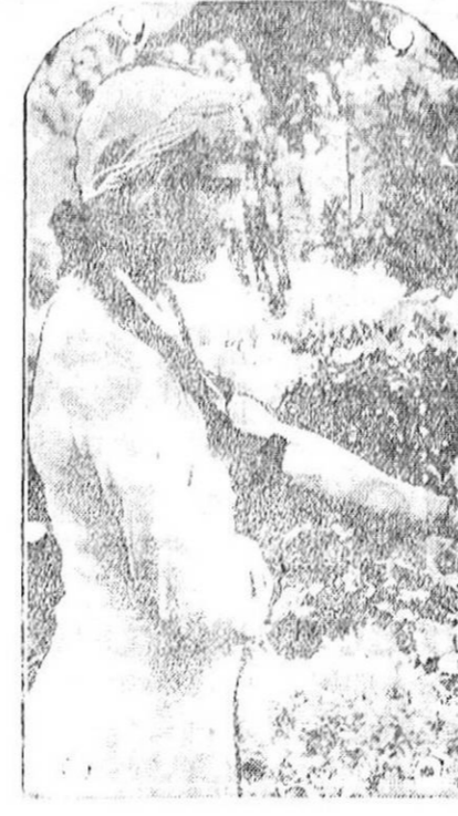
Concurso de crisantemos organizado en Barcelona por el Patronato de las ramblas de las flores.

EL DEFENSOR confecciona dos ediciones diarias