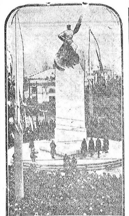
En Varsovia acaba de inaugurarse un interesante monumento, que reproduce el grabado, a los aviadores polacos recientemente muertos en accidentes. Al acto, que revistió gran solemnidad, asistieron las primeras autoridades de la República y un público numerosísimo. El monumento es obra del profesor E. Wittig.