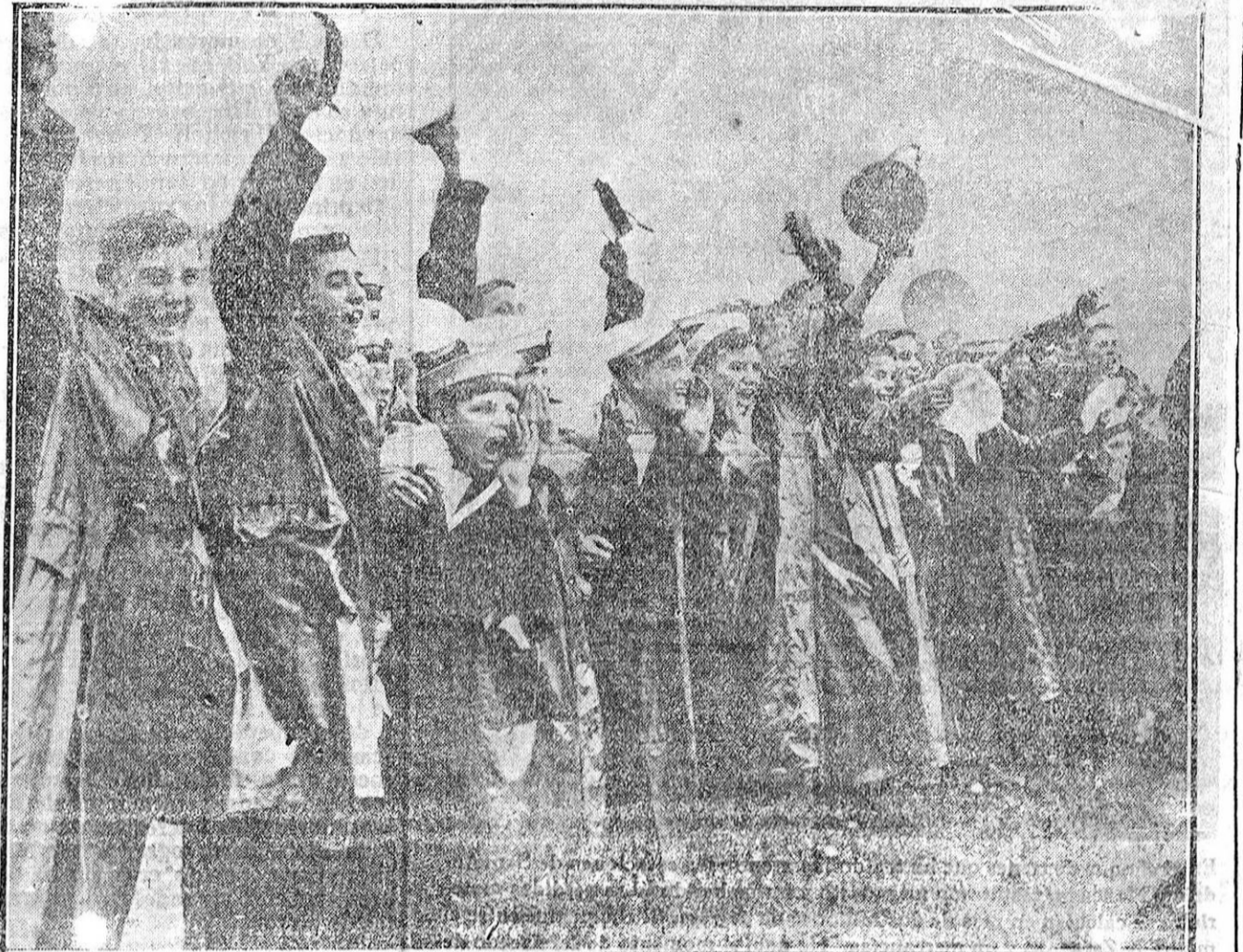
Estos muchachos forman parte del equipo de entrenamiento del acorazado «Warspite», y saludan con gritos de entusiasmo a sus compañeros que hacen su turno en competencia de remolques en maniobras de combate.