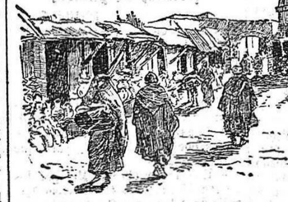
Babat.—La calle de los alfareros.

Cosas de Marruecos. Muchas son las manifestaciones que de Marruecos ofrece respecto al rigorismo con que observa las más añejas tradiciones, siendo una de las más cuidadosamente observadas la que se refiere á su comercio é industria. Como ocurría en las ciudades españolas de la Edad Media, cada gremio, cada industria se halla establecido en una calle especial que lleva su nombre.