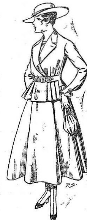
Trajes de lanilla, para señora, A ptas. 70.