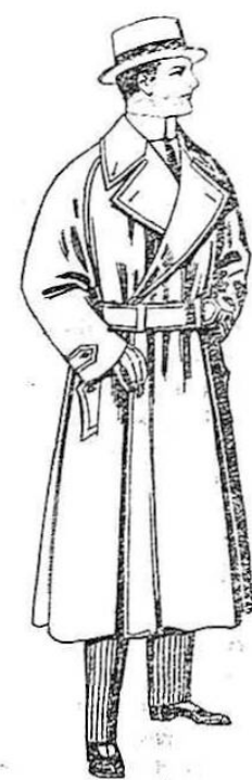
Gabanes impermeabilizados en colas beige. De ptas. 65 a 100.