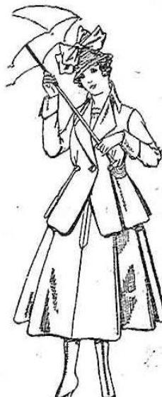
Trajes de lanilla, para jovencitas de 13 a 16 años. De ptas. 53 a 55.