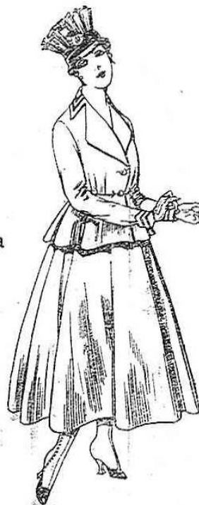
Trajes de lanilla, para señora. A ptas. 80.