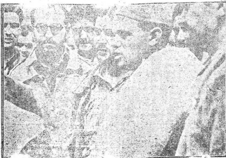
Grupo de prisioneros rojos de un sector de Levante.

Tomaron la salida noventa y seis corredores.