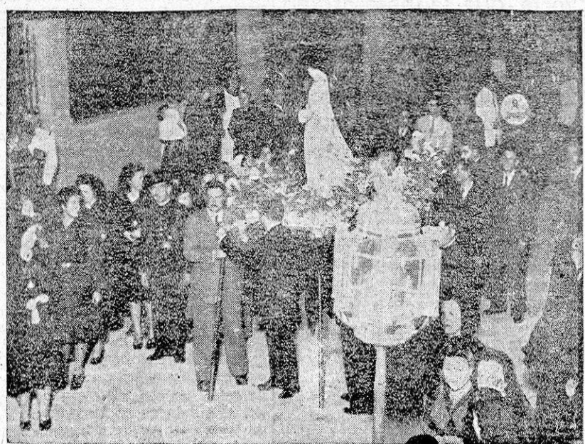
LA IMAGEN DE LA DOLOROSA A SU PASO POR LAS CALLES DE LA CAPITAL. (Información en 4.ª página.)