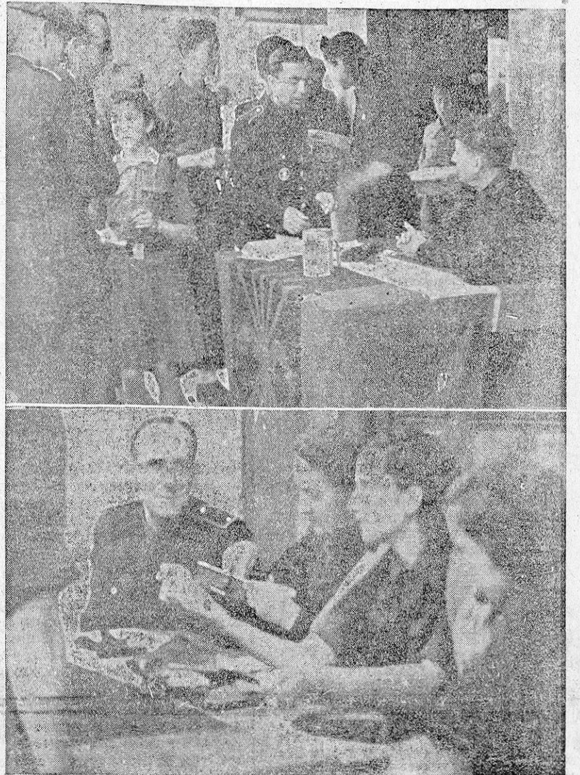
LAS JERARQUIAS DE LA FALANGE PRESIDEN LAS MESAS EN LA CUESTACION DEL F. DE J.J.