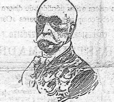
El exministro de Estado, señor marqués de Aguilar de Campo