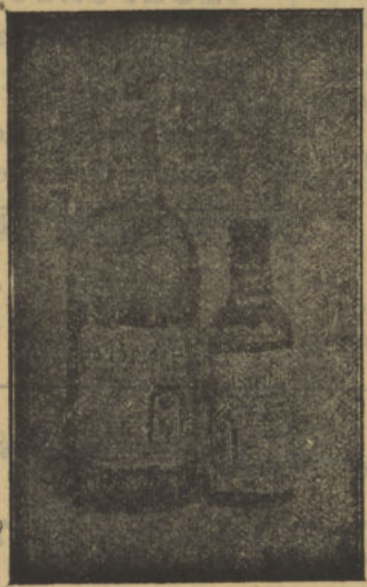
Facsimil de las botellas

Los sermones, música, adorno de altar, todo este año ha resultado hermosísimo, viéndose el templo lleno de fieles durante todos los actos, por lo que merecen plácemes cuantos han contribuido á tanto esplendor.