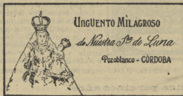
MARCA REGISTRADA Y DEPOSITADA