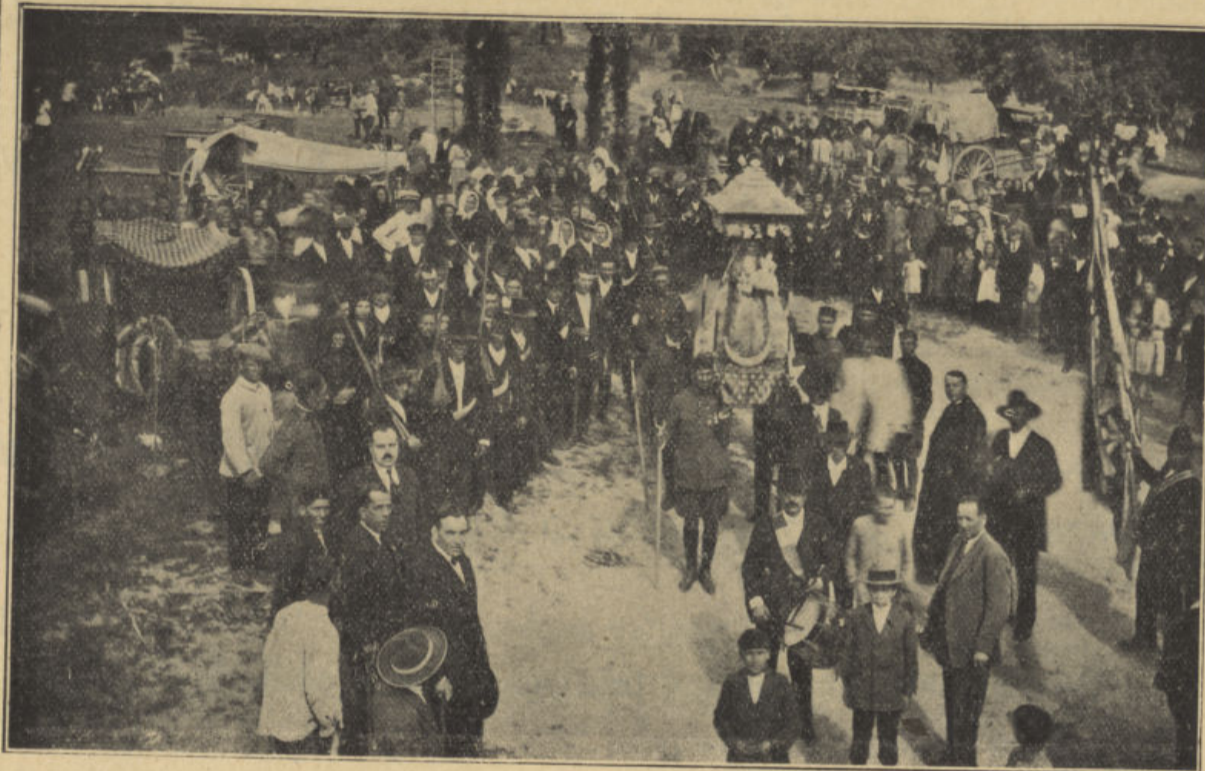
Vista tomada desde el Santuario de Ntra. Sra. de Luna en la última festividad antes de entrar la imagen en su ermita.

En lo que a España se refiere, no existe región que no cuente con algún templo levantado en su honor, para celebrar favores especialísimos, recibidos milagrosamente de sus poderosas manos. Sobre todo, An-