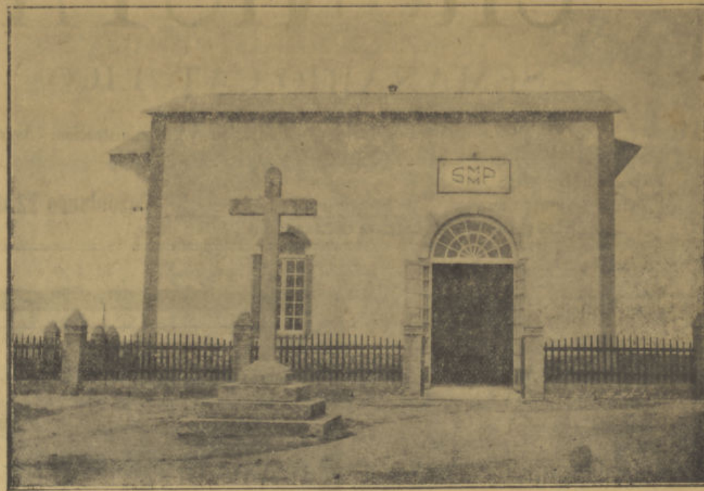
Sub-Estación transformadora de energía eléctrica de 70.000 a 15.000 voltios. Se hallan instalados en ella los aparatos de seguridad y medida para la toma de energía para las líneas de 15.000 voltios